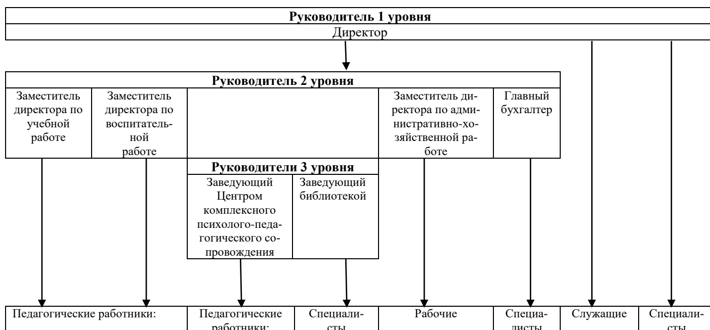
Рисунок 1. Организационная структура

Организационная структура учреждения является линейной (рисунок 1), не исключая горизонтальные связи между коллегиальными органами управления.